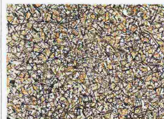
Un particolare di Advance of History (1964) di Mark Tobey

"Luce filante". Questo il titolo della retrospettiva che riepiloga gli ultimi vent'anni di attività del pittore americano Mark Tobey. Affascinato dall'Oriente, fonda il proprio linguaggio sulla White Writing , portando un contributo originale all'astrattismo. Fino al 10 settembre. guggenheim-venice.it