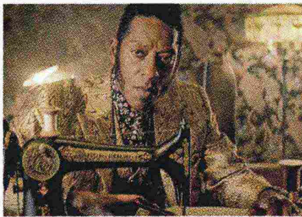
Orlando Jones in American Gods