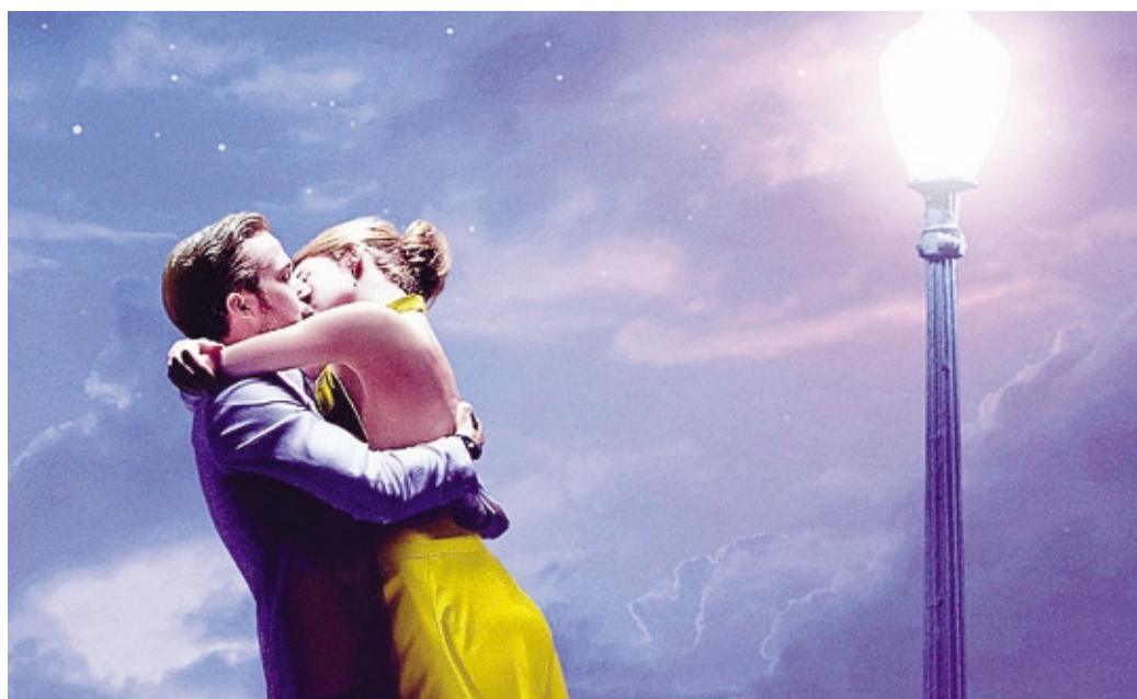
Una delle spettacolari scene del film «La La Land», che questa sera verrà analizzato sotto il profilo filosofico

Chi che gh'è mai tēp de fa ergót, i è chi che fa negót Chi non ha mai tempo di fare qualcosa è colui che non fa niente